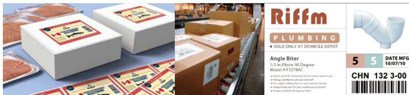
制造行业外箱标签

在彩色标签打印领域，TM-C7520G是使用爱普生最新PrecisionCore行式打印技术的全新一代全彩色标签打印机。基于爱普生特有的ESC/Label 指令语言，替代了预印刷彩色套打可变信息的传统模式，实现超高速高质量的彩色标签按需打印！