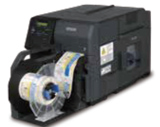
ColorWorks TM-C7520G 超高速全彩色标签打印机