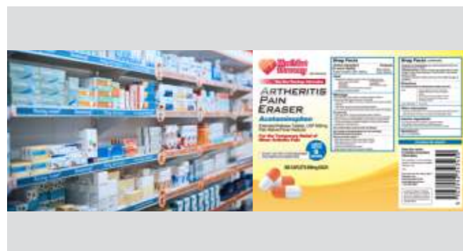
医疗行业 药品/医疗器械标签