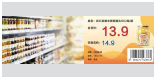
零售行业 彩色价签