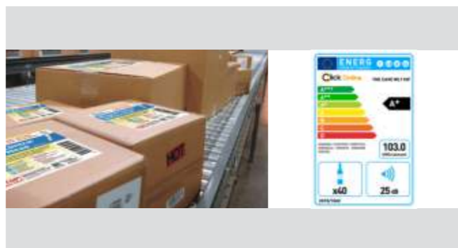
制造行业 能耗标识